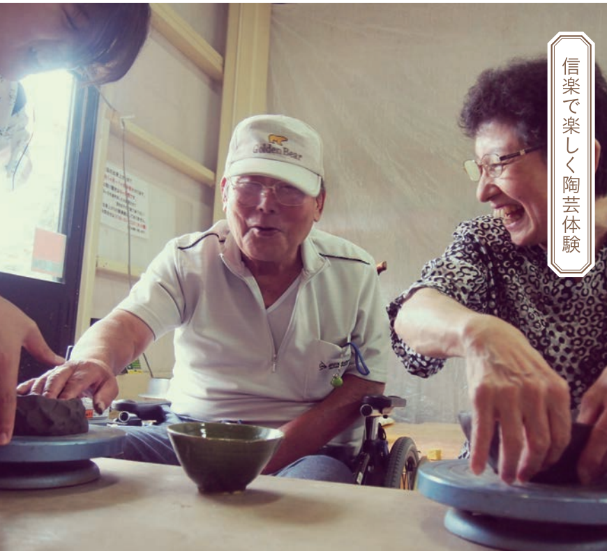
信楽で楽しく陶芸体験