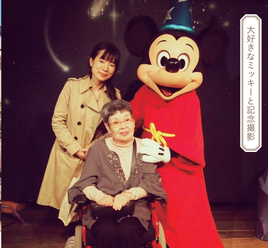
大好きなミッキーと記念撮影