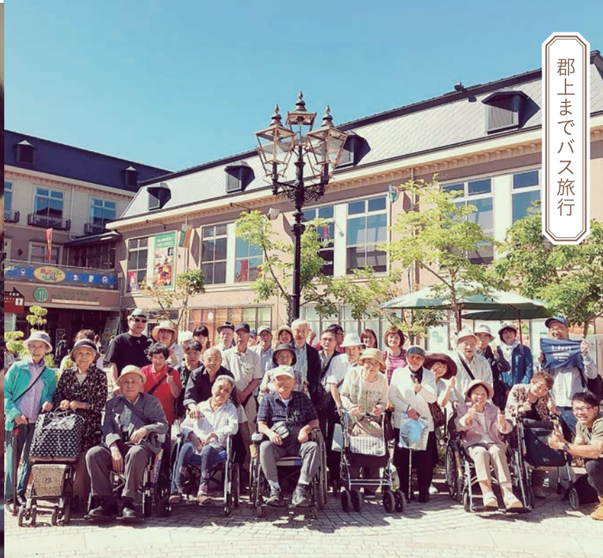
郡上までバス旅行